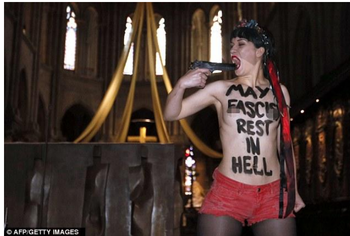
Indignación: La activista Femen en topless burlándose del suicidio público de Dominique Venner