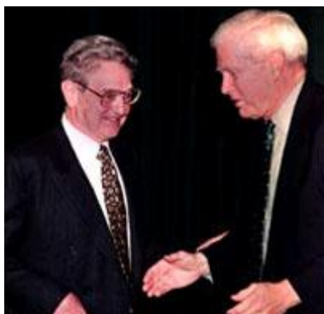
James Billington (derecha) con George Soros en 2001

Su director es un tal James H. Billington, director de la Biblioteca del Congreso de EE.UU., hizo sus estudios en la Universidad de Princeton, doctorado en el prestigioso Balliol College de Oxford, y luego profesor en Princeton y además fundador del Instituto Kennan de Estudios Avanzados de Rusia, miembro del influyente Consejo de Relaciones Exteriores de EE.UU. un auténtico lobby de la política exterior norteamericana, durante muchos años fue consultor para sus equipo especializado de Asuntos Exteriores ... Ah, y fundador del Programa Open World, un Centro de Liderazgo asociado con oficinas en Washington DC y una sucursal en Moscú.