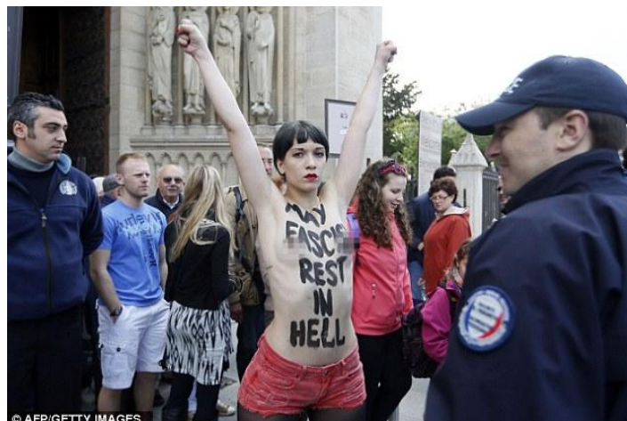
Protesta "antifascista": La mujer descrita como Femen del 'Ángel de la Muerte', fue arrestado por la policía fuera del edificio religioso