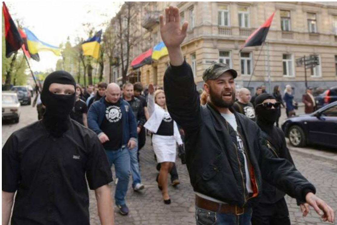
Sobran los comentarios...