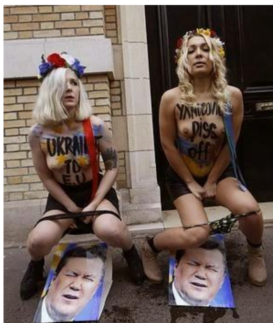
Todo un estilo. Dos especímenes de FEMEN orinando sobre retratos del Presidente de Ucrania, Victor Yanulovicht, en medio del golpe de Estado en Kiev

Con estos comentarios quedaba claro que Femen se ha financiado durante años gracias a un magnate de los EE.UU. ¿Qué credibilidad puede tener la reciente afirmación de Sunden de que prácticamente había financiado Femen sólo selectivamente para las campañas contra el turismo sexual? Lamentablemente, no es posible comprobar este punto.