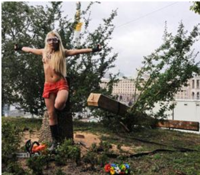
Inna Shevchenko blasfemando en agosto de 2012 en Kiev tras cortar la cruz por las víctimas del stalinismo

El pensamiento anticristiano de Femen es obvio. Algunos suponían que eran ecos de la era soviética, en la que los cristianos eran oprimidos y perseguidos, nada más falso. Más bien, es la evidencia de un nuevo materialismo agresivo, que se basa en la superficialidad instintiva contra cualquier orden tradicional o natural.