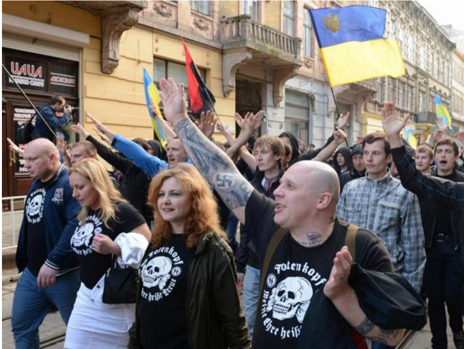
Pueden verse las banderas de los criminales escuadrones del Sector Derecho que operan en Ucrania contra los prorusos.